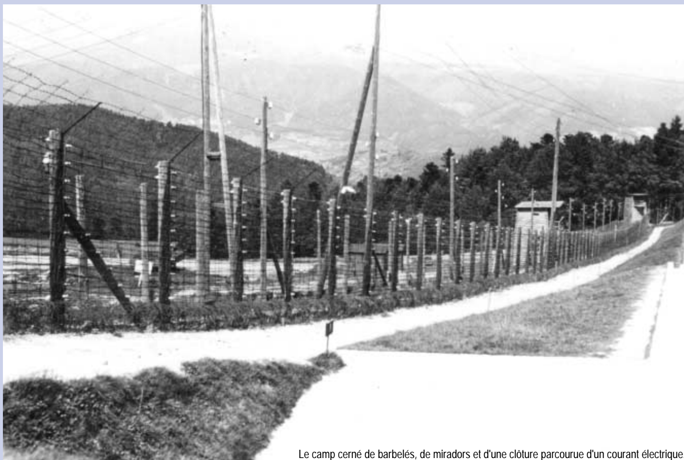
Le camp cerné de barbelés, de miradors et d'une clôture parcourue d'un courant électrique.

À Natzweiler-Struthof, le 3 novembre, sera officiellement inauguré le Centre européen du résistant-déporté. Le site de ce camp, seul KL nazi en France (dans ses frontières actuelles) est visité chaque année par des dizaines de milliers de scolaires et de citoyens européens. Ce centre contribuera à faire connaître non seulement le camp lui-même mais l'ensemble du système concentrationnaire.