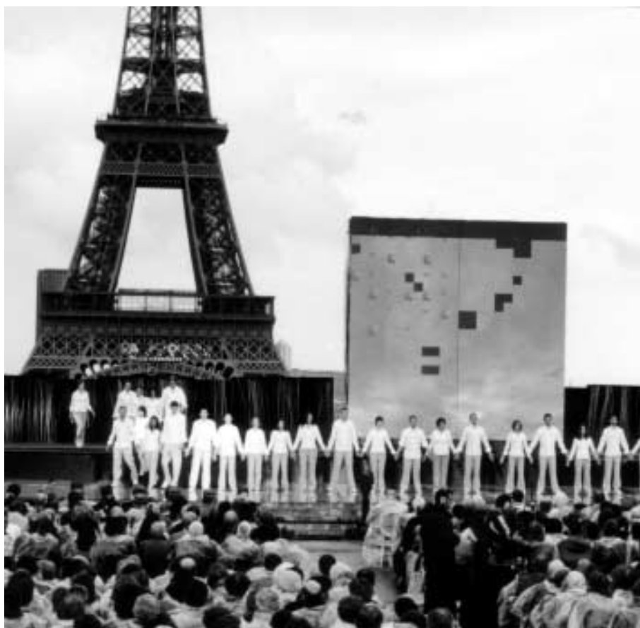
L'émouvante cérémonie du Trocadéro fut, malgré la météo, un des temps forts de la Journée nationale de la Déportation commémorant le soixantième anniversaire de la libération des camps.

À NOTER : la prochaine visite commentée des monuments des camps au cimetière du Père-Lachaise à Paris aura lieu le mardi 18 octobre. Rendez-vous à 14 heures 30 à l'entrée rue des Rondeaux.