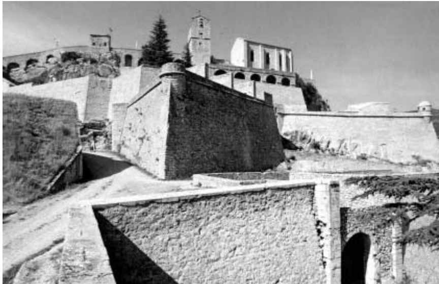
Citadelle de Sisteron.